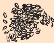
Britisk dyrket Høfrø